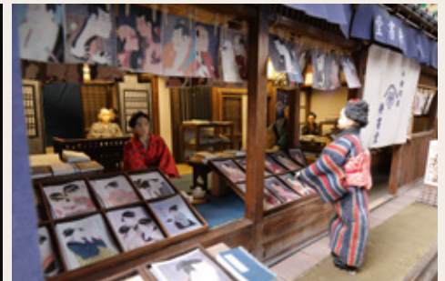
再現された「耕書堂」の店先

江戸の伝統文化や暮らしを学ぶ! ※対象=特別展入館者 定員=各回50名(★印は80名) 申込み★印のみTEL・メールで要事前申込