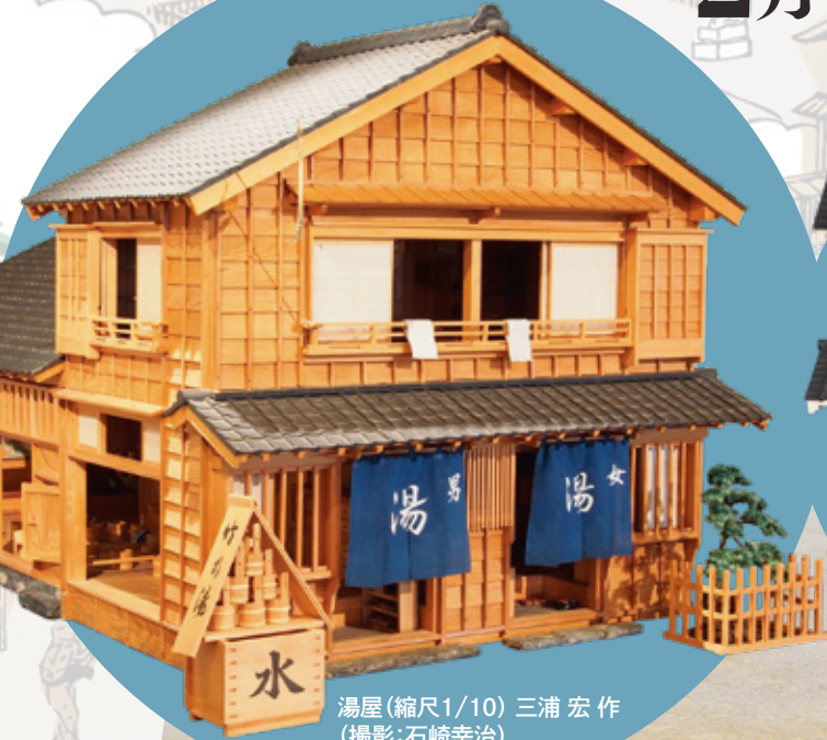
湯屋(縮尺1/10) 三浦 宏 作