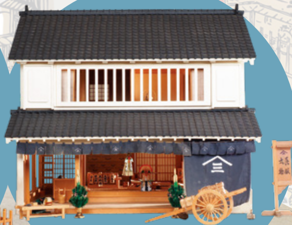
呉服屋(縮尺1/10) 三浦 宏 作