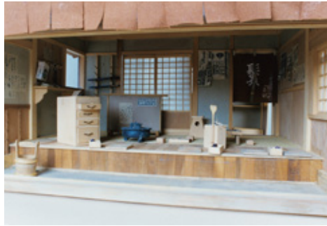
床屋(浮世床)の内部 縮尺1/10