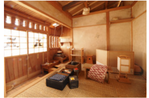
棟割長屋の内部 縮尺1/10